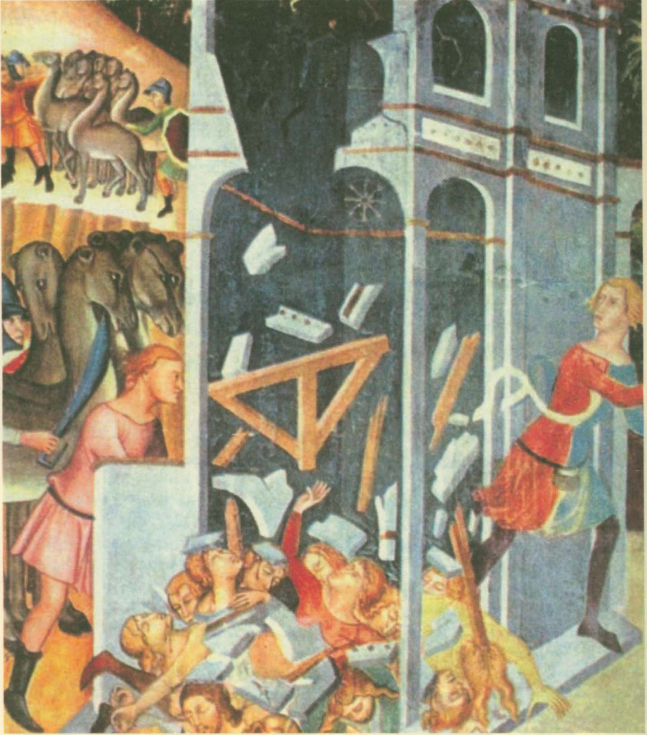
Istanbul bir deprem ile sallanıyor

mahrum olan ortaçağ dünyasının insanı için, bunu, tabii karşılamak durumunda olduğumuzu da düşünüyorum. Ayrıca, Bizans tarihçilerinin kayıtlarına dayanarak IV.-XI. yüzyıllar arasında İstanbul'un hiçbir zaman bir depremin merkez üssü olmadığı ve deprem felâketiyle yer-yüzünden silinen birçok şehrin talihsiz kaderini paylaşmadığı görüşünde olduğumu da belirtmek istiyorum.